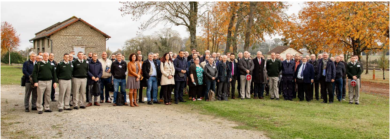
Participants à la rencontre PME – MCO-T organisée à la 12 e BSMAT à Neuvy-Pailloux (Indre) le 4 novembre 2021